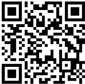
Aktuelle Termine & Anmeldung

Weitere Informationen finden Sie auf unseren Social- Media-Kanälen: